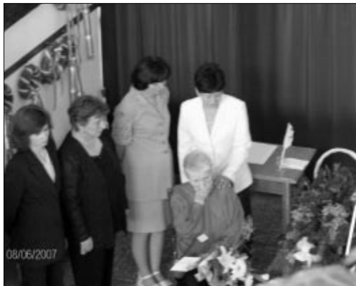
Volt tanítványok körében

nem csak a szemem, a lelkem is mosolyogni kezdett. Váratlanul tört elő bennem a felismerés.