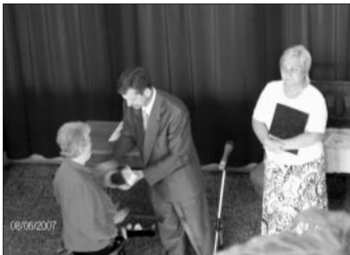
A diplomaátadás megható pillanata

Én, a volt kollega csendes meghatottsággal szemléltem az eseményeket. Néztem, ahogy ott áll egymással szemben a két ember, s egyszerre