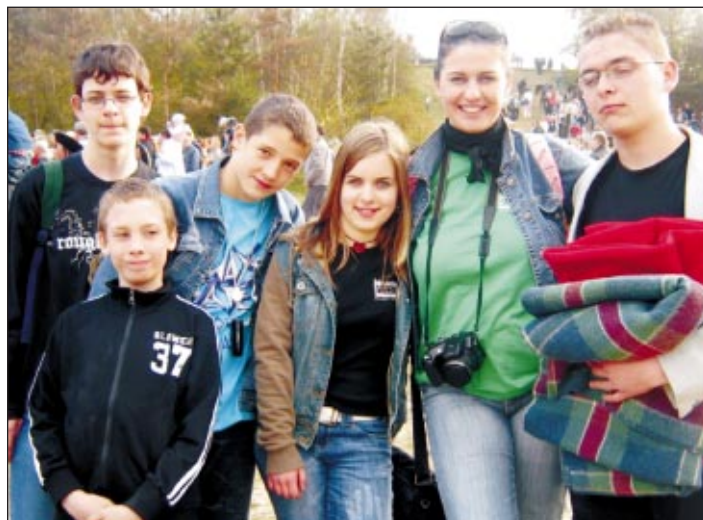
Megyelakók Környezetvédelmi túranapon