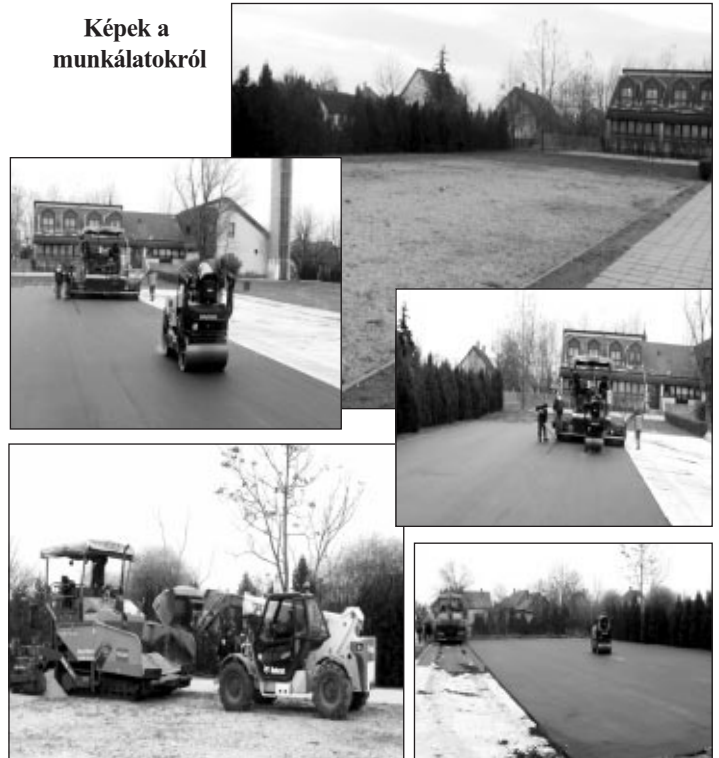
Képek a munkálatokról