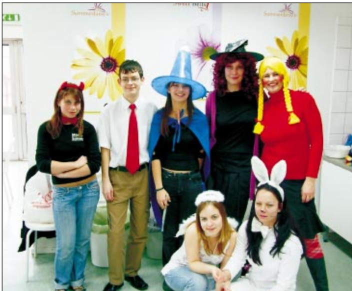
Együtt farsangoltunk idén is