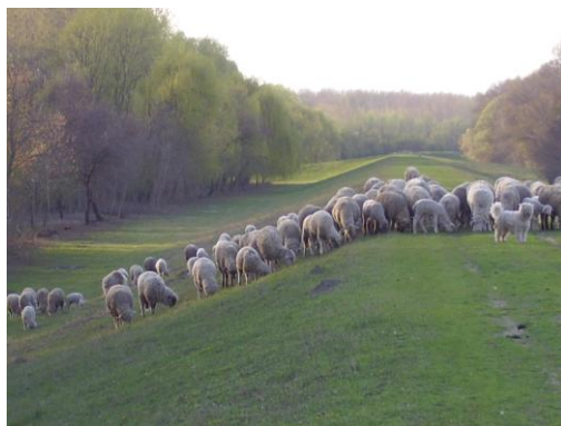
2. helyezett (Tóth Csilla)