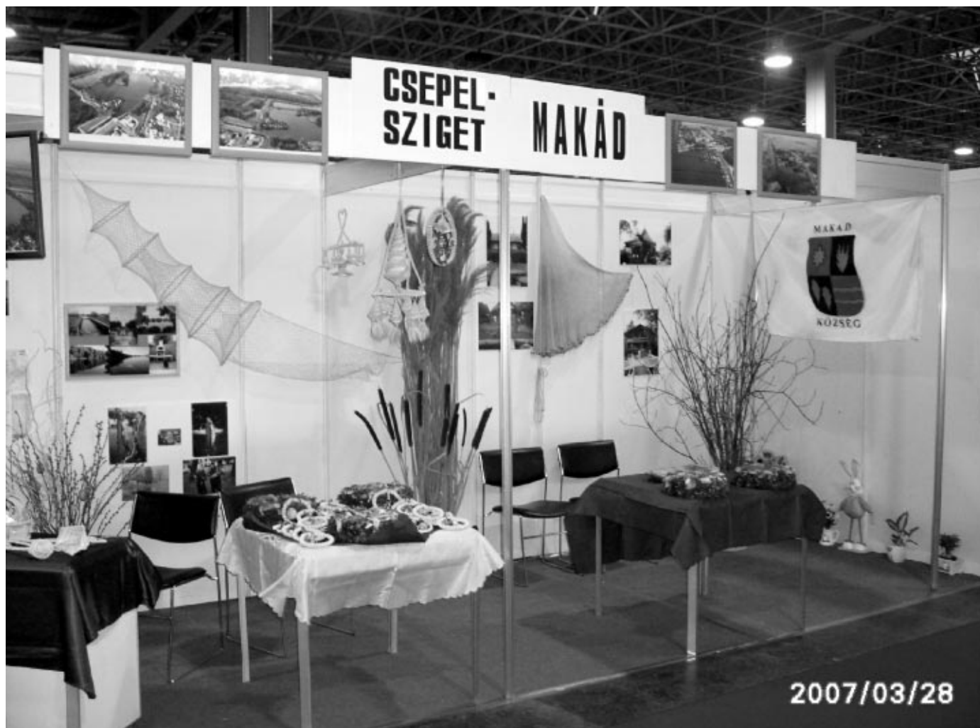
Makád község standja az Utazás 2007 kiállításon